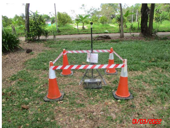
โรงเรียนวัดท่าแคลง