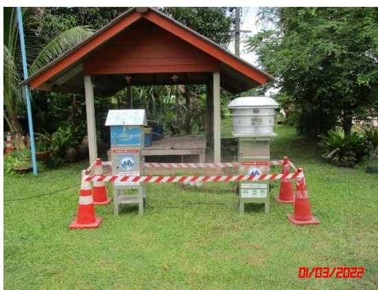
บ้านสองพี่น้อง