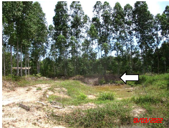
รูปที่ 2-6 บ่อรองรับน้ำ