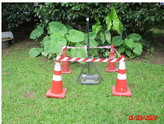
บ้านสองพี่น้อง