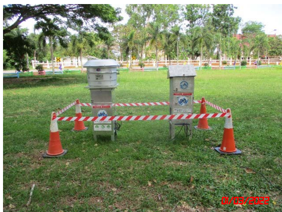
โรงเรียนวัดท่าแคลง