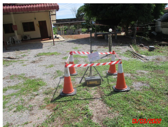
บ้านคลองชุดบน