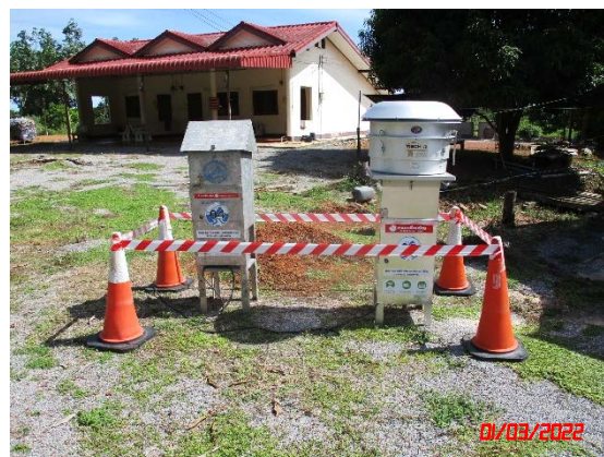
บ้านคลองชุดบน