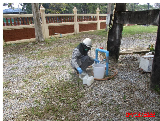
น้ำบาดาลบ้านท่าแฉ่ง