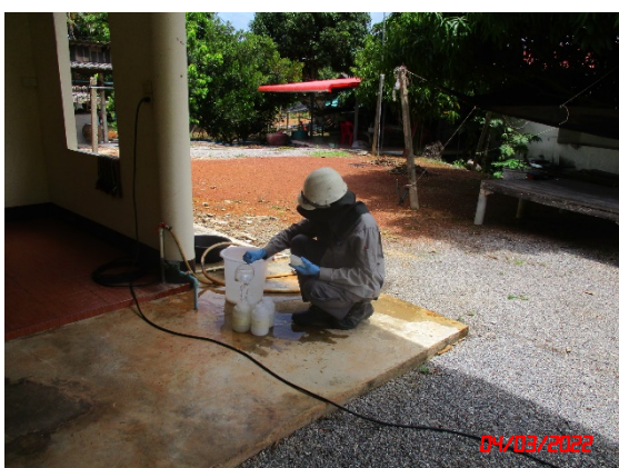
น้ำบาดาลบ้านคลองขุดบน