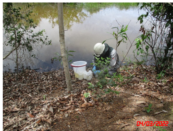
คลองสาธารณะประโยชน์